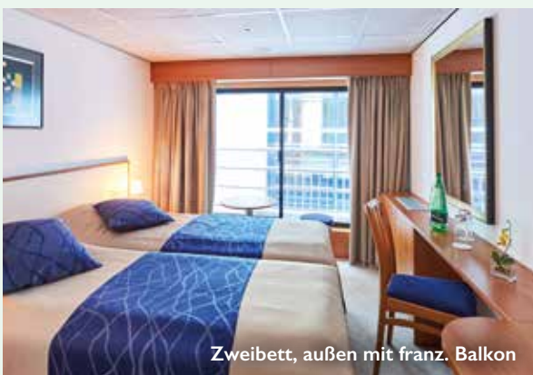
Zweibett, außen mit franz. Balkon