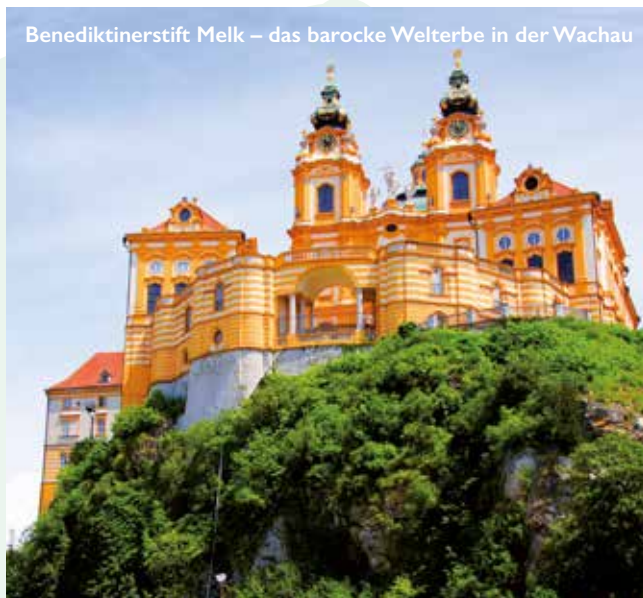
Benediktinerstift Melk – das barocke Welterbe in der Wachau