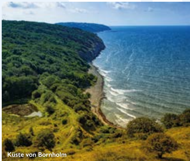
Küste von Bornholm

Mit Bornholm und Kopenhagen noch zwei unterschiedliche Seiten von Dänemark entdeckt, nehmen Sie einen Koffer voller Erinnerungen mit nach Hause.