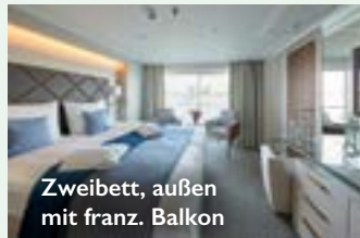
Zweibett, außen mit franz. Balkon

Ihre Zahlungen sind gemäß der gesetzlichen Bestimmungen über DRSF, Deutscher Reiseversicherungsfonds GmbH, Sächsische Straße 1, 10707 Berlin, versichert.