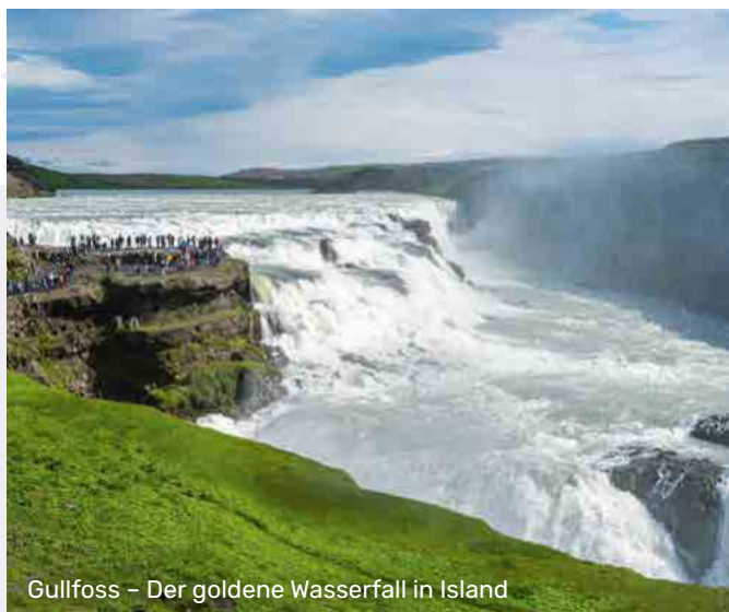
Gullfoss – Der goldene Wasserfall in Island

Die Passage durch den sagenhaften Prins Christian Sund zählt zu den unvergesslichen Höhepunkten – ein Naturwunder aus Eis, Fels und Licht, das den Atem raubt und das Herz erfüllt.