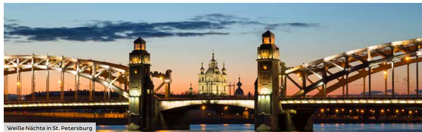
Weißer Nächte in St. Petersburg