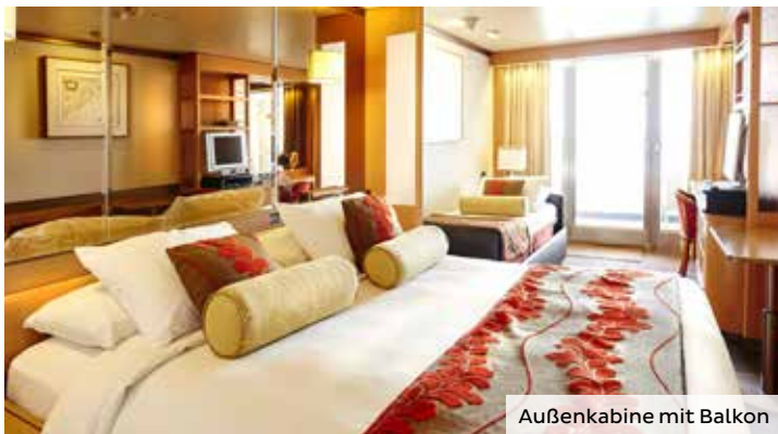
Außenkabine mit Balkon