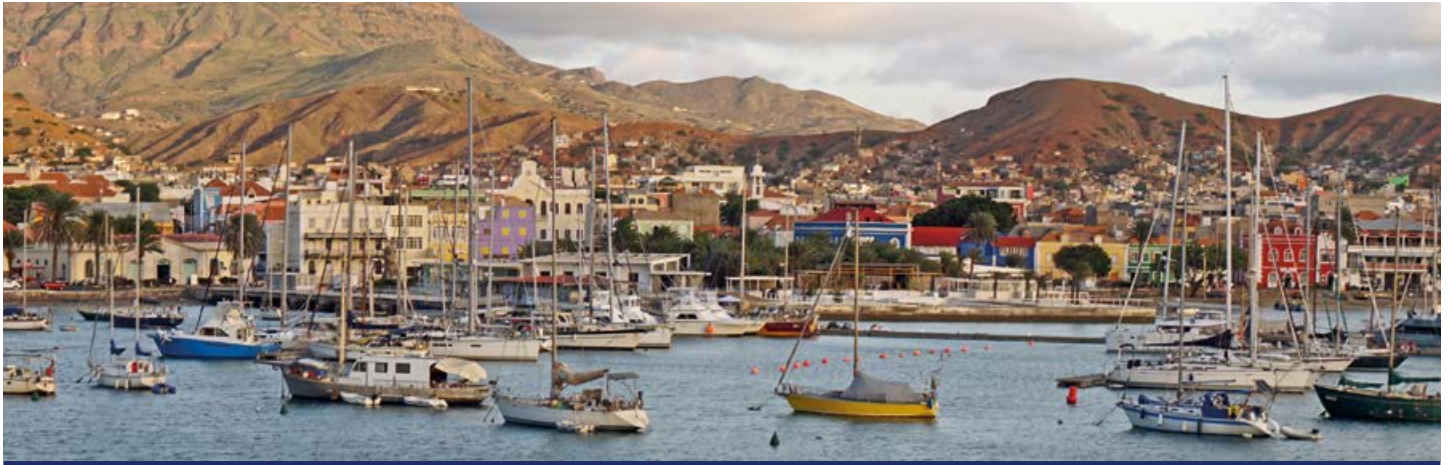
Mindelo auf den Kapverden