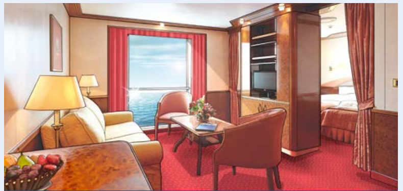
Modellbild einer Suite der Kategorie 12