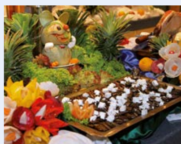
Leckeres vom Buffet