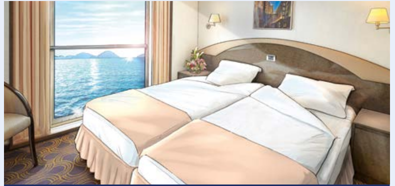
Modellbild einer Kabine der Kategorie 10