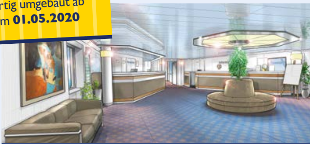
Der neugestaltete Rezeptionsbereich (Modellbild)