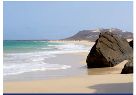
Strand von Boavista