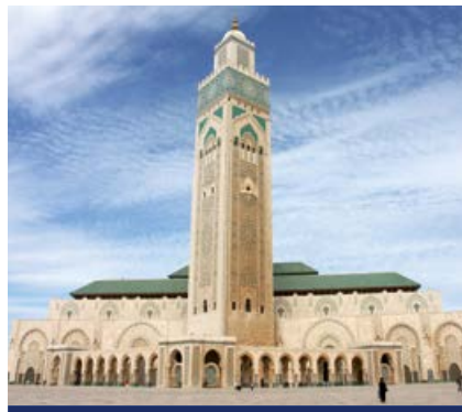
Hassan-II.-Moschee in Casablanca