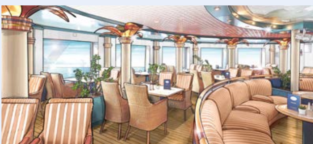
Der hellere und gemütliche Palmgarten (Modellbild)