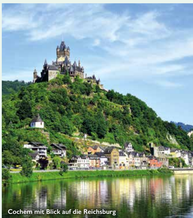
Cochem mit Blick auf die Reichsburg

Nachdem Sie vom Aussichtspunkt Cloef über die idyllische Saarschleife geblickt haben, bestaunen Sie in Bernkastel die nostalgischen Fachwerkhäuser rund um den Marktplatz und in Traben-Trarbach die imposante Grevenburgruine. Das idyllische Zell im Herzen der Moselschleife rundet diese Romantikkreise dann noch gekonnt ab.