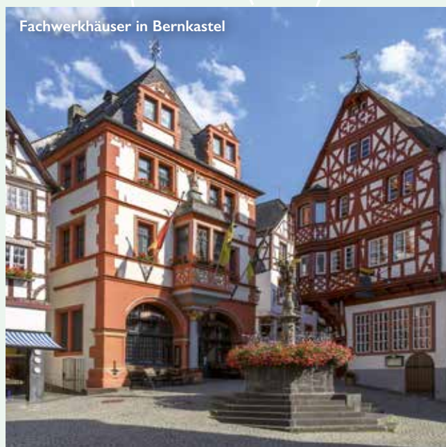
Fachwerkhäuser in Bernkastel