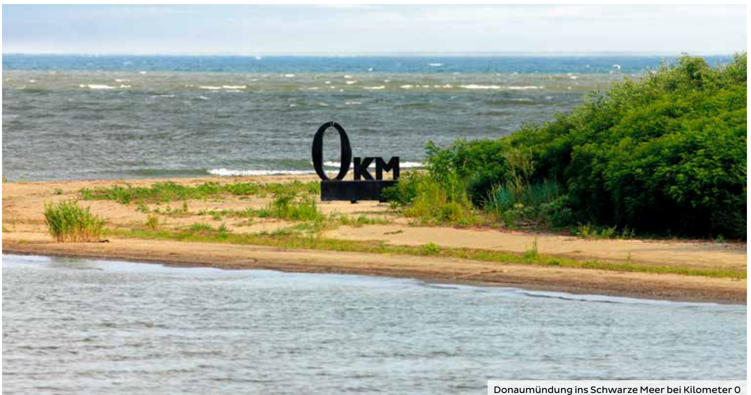
Donaumündung ins Schwarze Meer bei Kilometer 0

Einreisebestimmungen: Für diese Reise benötigen deutsche Staatsbürger einen gültigen Reisepass, welcher mindestens 3 Monate nach Reiseende gültig sein muss. Ohne gültige Ausweisdokumente kann die Reise nicht angetreten werden. Gesundheit: Über Infektions- und Impfschutz sowie andere Prophylaxe-Maßnahmen sollten Sie sich rechtzeitig bei Ihrem Hausarzt informieren. Bis 30 Tage vor Reisebeginn zu erreichende Mindestteilnehmerzahl für diese Reisen: 160 Personen (siehe Ziff. 8.1. unserer Reisebedingungen).