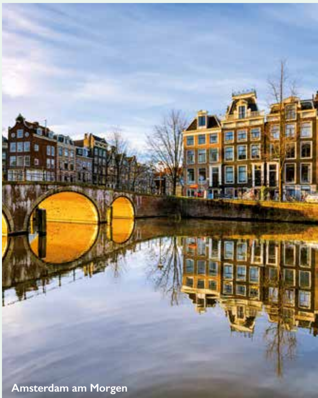
Amsterdam am Morgen