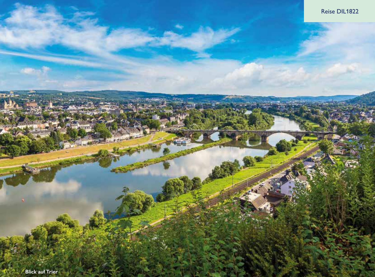
Blick auf Trier