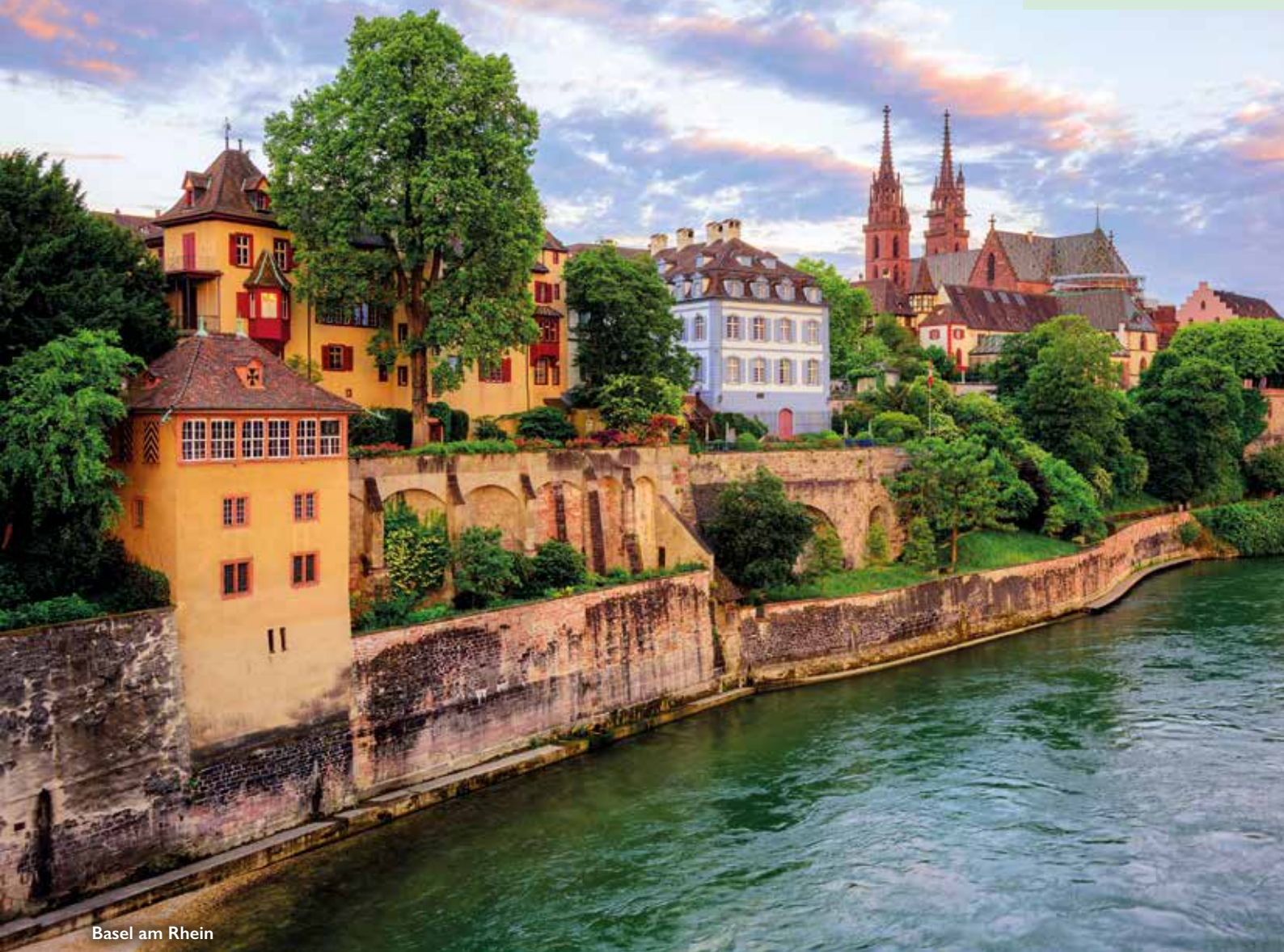
Basel am Rhein