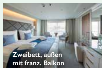
Zweibett, außen mit franz. Balkon