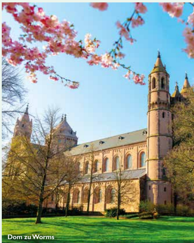
Dom zu Worms