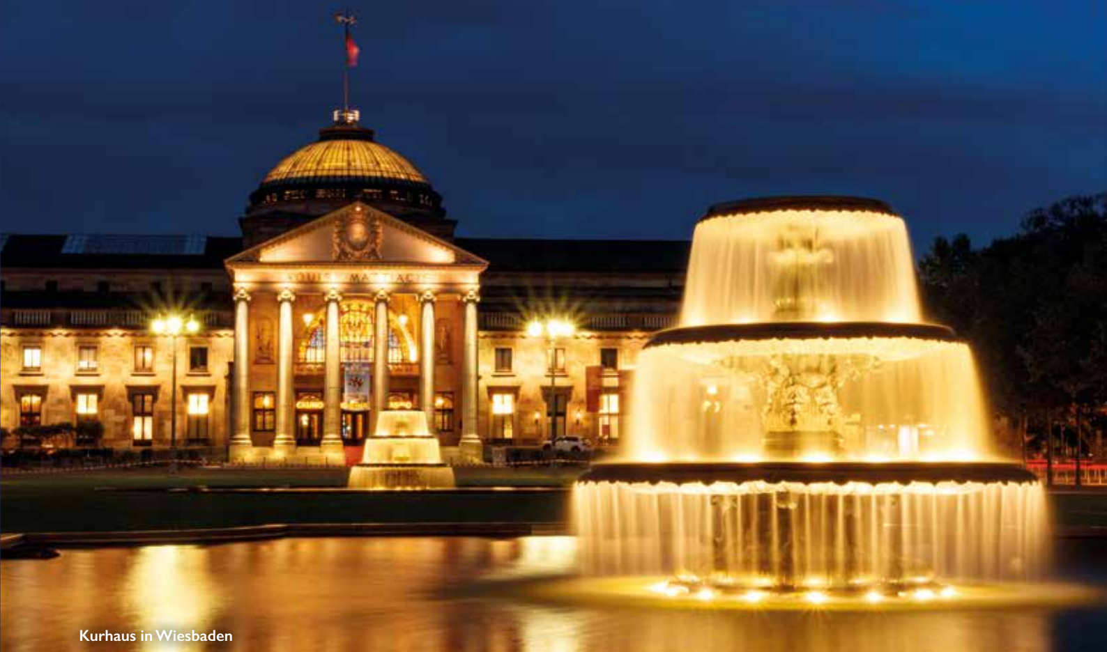
Kurhaus in Wiesbaden