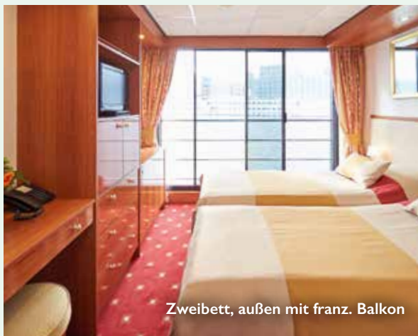
Zweibett, außen mit franz. Balkon