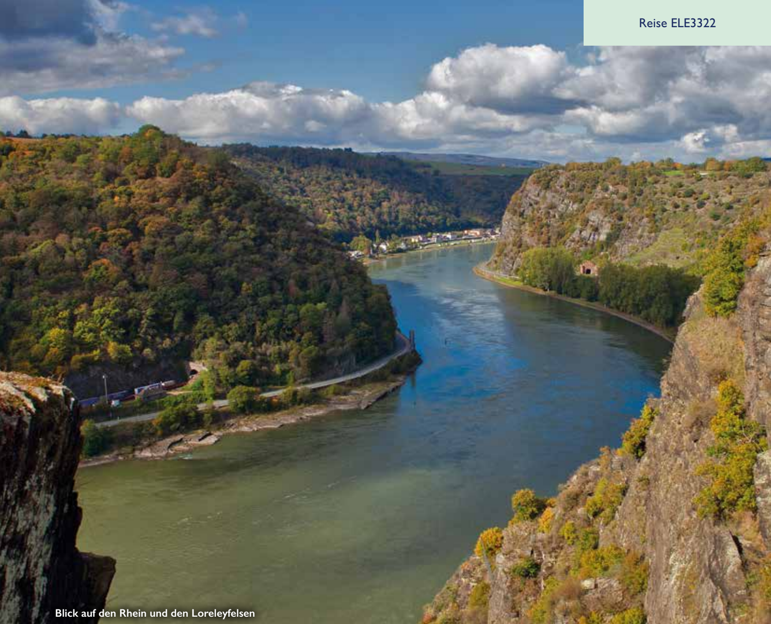
Blick auf den Rhein und den Loreleyfelsen