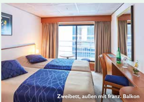
Zweibett, außen mit franz. Balkon