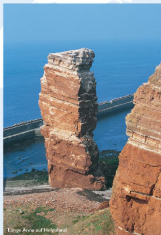
Lange Arva auf Helgoland